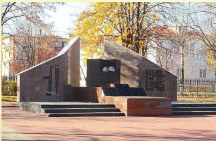
Памятник горнякам - первопроходцам комбината «КМАруда»