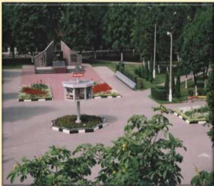
Центральная часть сквера «Шахтёрская слава» имени В.М. Кислова