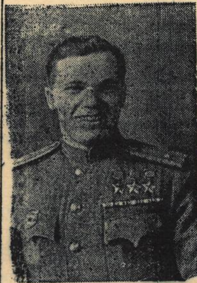
Трижды Герой Советского Союза гвардии майор Иван Никитович Кожедуб.