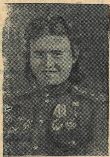
Герой Советского Союза гвардии старший лейтенант Евдокия Борисовна Пасько в Красной Армии с октября 1941 года. Награждена она двумя орденами Красной Звезды, орденом Красного Знамени, орденом Отечественной войны I степени. На боевом счету штурмана эскадрильи тов. Пасько 800 боевых самолетовлетов и около 100 тысяч килограммов бомб, сброшенных на укрепления противника.

Сделаем изб-читальни подлинными очагами культуры, лучшими помещениями колхозов в борьбе за успешное проведение весеннего сева, за получение высокого урожая.