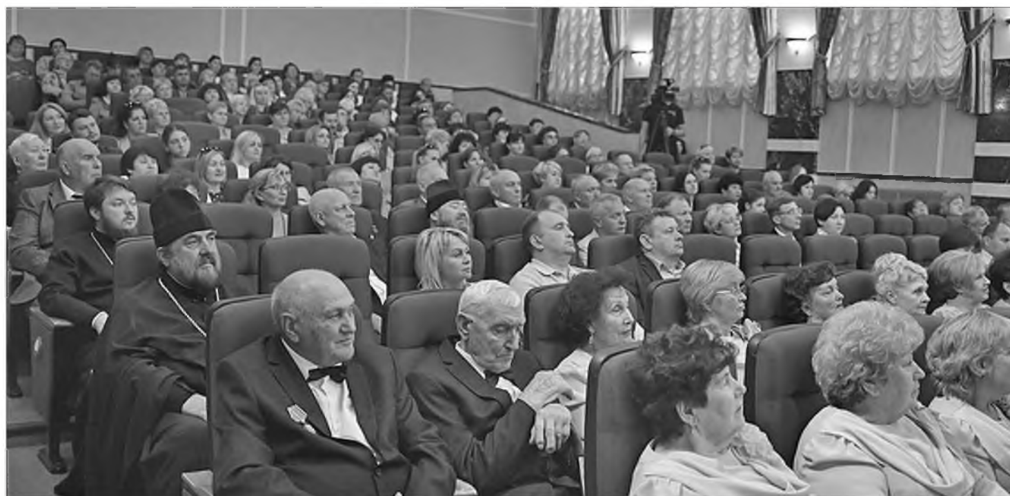
Почётные гости и зрители в зале

Познакомиться с книгой «Земля Губкинская: история и современность» можно в библиотеках города. Она будет интересна широкому кругу читателей.