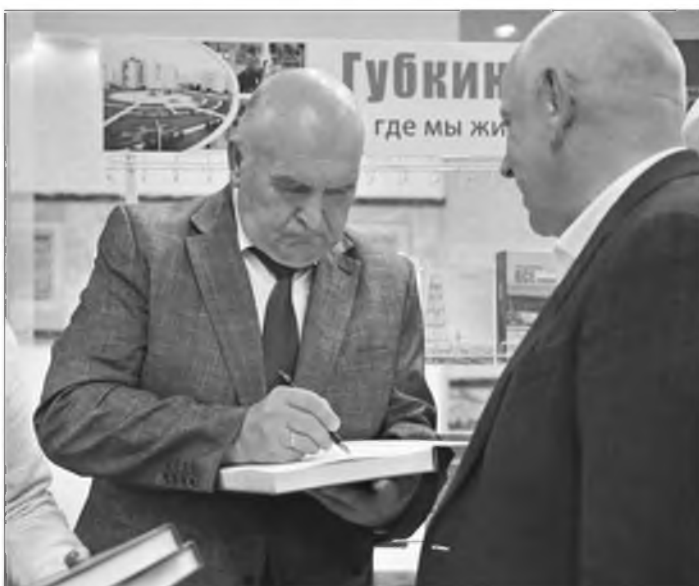
Автор даёт автограф