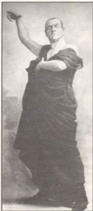
Ф. И. Шаляпин — Мefистofель в опере "Мefистofель" (1912)

Идея создания каталога шаляпинской библиотеки возникла в научных кругах