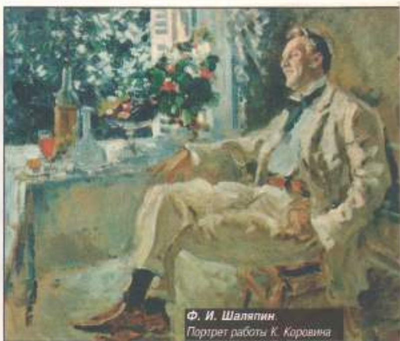
Ф. И. Шаляпин. Портрет работы К. Коровина

Ознакомление с тематикой более девяти сот томов сосредоточенной в Москве личной биб-