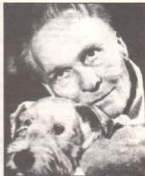
Ф. И. Шаляпин.

Многочисленные книги библиотеки великого артиста, сосредоточенные в московских музеях, могут восприниматься как обширный комментарий и дополнение к шаляпинскому труду в той степени, в какой люди искусства, готовящие себя к “священной серьезности игры”, захотят проникнуться шаляпинским методом работы, ознакомиться с первоисточниками самообразования и создания роли.