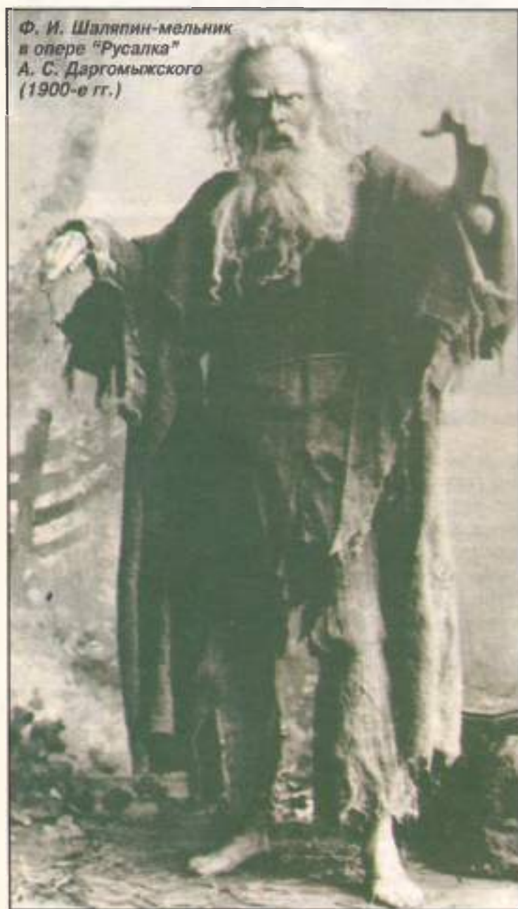
Ф. И. Шаляпин-мельник в опере “Русалка” А. С. Даргомыжского (1900-е гг.)

скую литературу о композиторах, в том числе статьи из Энциклопедии.