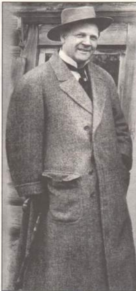
Ф. И. Шаляпин в деревне Ометово (1912)

Исследование зон внимания Ф. Шаляпина в книгах о мастерах эпохи Возрождения, в частности о Леоне Батисте Альберти и Леонардо да Винчи, позволяет раскрыть подлинное содержание сопутствующего артисту эпитета “наследник гуманистических традиций”. Но Альберти не только определяет его художническое мировоззрение. Единую психологическую основу составляет потребность бесконечного совершенствования. Владение мировым культурным наследием, высокое умственное и духовное развитие предстают с по-