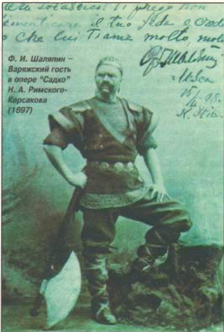
Ф. И. Шаляпин — Варяжский гость в опере “Садко” Н. А. Римского- Корсакова (1897)