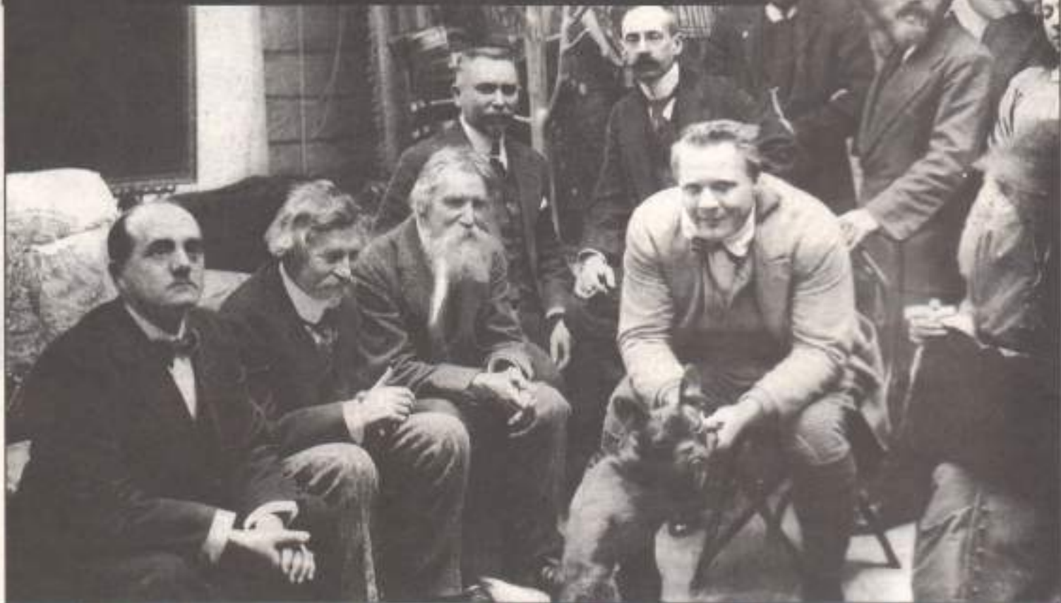
Ф. И. Шаляпин с группой артистов в гостях у И. Е. Репина в Пенатах, Куоккала (1914)

Знакомство с содержанием книг, побывавших в руках Ф. Шаляпина, дает новые смысловые ключи, позволяющие за многими строками его собственной книги увидеть обширное пространство невысказанного. Благодаря исследованию взаимоотношений артиста и книги появляется возможность проникнуться мышлением Шаляпина, проследить истоки, из которых родились понятия шаляпинской оперной эстетики и феномена перевоплощения.