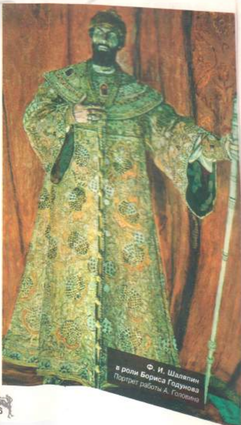
Ф. И. Шаляпин в роли Бориса Годунова Портрет работы А. Головина

Судьба библиотеки Шаляпина сложна. В годы эмиграции дочь Ирина, оставшаяся в России и стремившаяся сохранить память об отце, его лич-